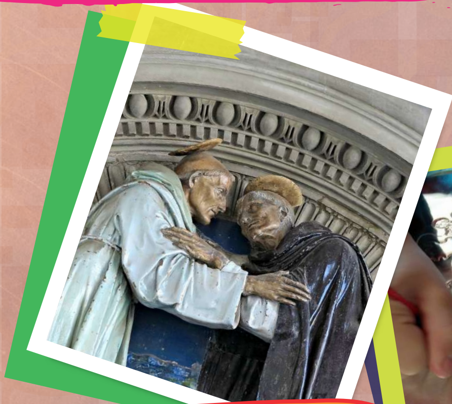
La terracotta invetriata di Andrea Della Robbia .